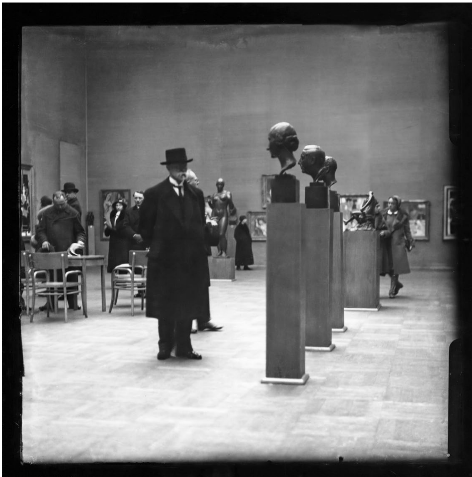
Josef Sudek: TGM ve výstavních sálech Obecního domu, 1923